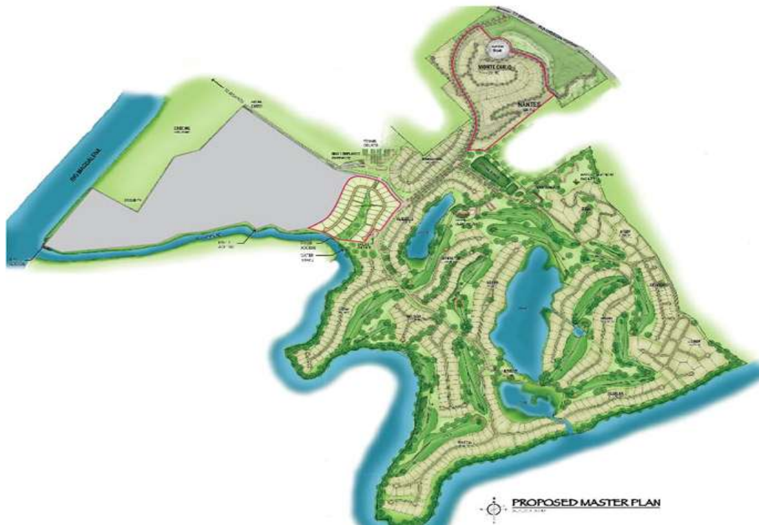
Figura 1. Plano Club Puerto Peñalisa

Aguas Marakatá S.A E.S.P. presta el servicio de acueducto y alcantarillado en el municipio de Ricaurte, departamento de Cundinamarca, en el Club Puerto Peñalisa. En la siguiente figura se presenta un plano sin escala del área de prestación del servicio al cual aplica el presente contrato de condiciones uniformes.